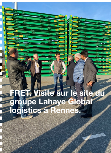
FRET. Visite sur le site du groupe Lahaye Global logistics à Rennes.