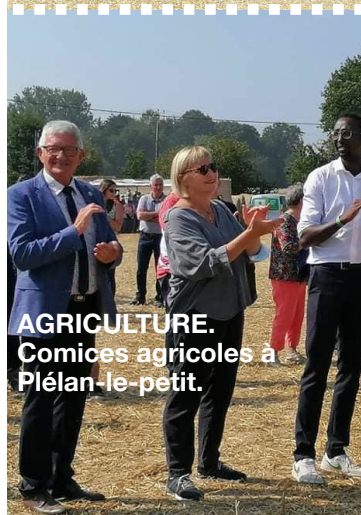
AGRICULTURE. Comices agricoles à Plélan-le-petit.