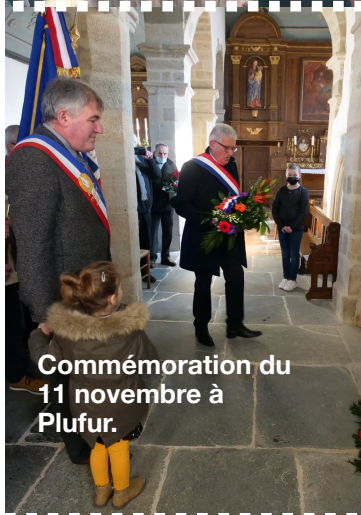
Commémoration du 11 novembre à Plufur.