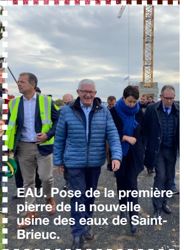
EAU. Pose de la première pierre de la nouvelle usine des eaux de Saint-Brieuc.