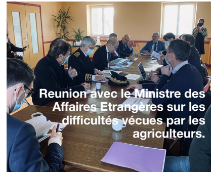
Reunion avec le Ministre des Affaires Etrangères sur les difficultés vécues par les agriculteurs.