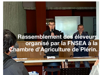
Rassemblement des éleveurs organisé par la FNSEA à la Chambre d'Agriculture de Plérin.