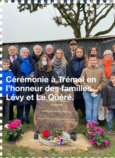
Cérémonie à Trémeil en l'honneur des familles Lévy et Le Quééré.