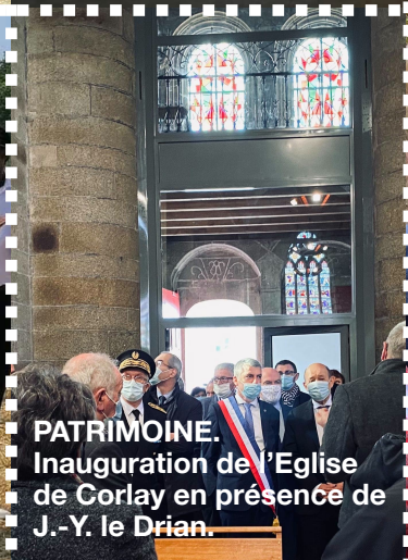
PATRIMOINE. Inauguration de l'Eglise de Corlay en présence de J.-Y. le Drian.