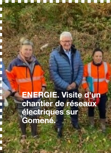
ENERGIE. Visite d'un chantier de réseaux électriques sur Gomené.