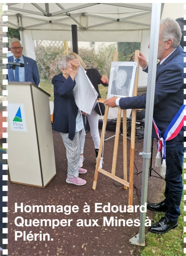
Hommage à Edouard Quemper aux Mines à Plérin.