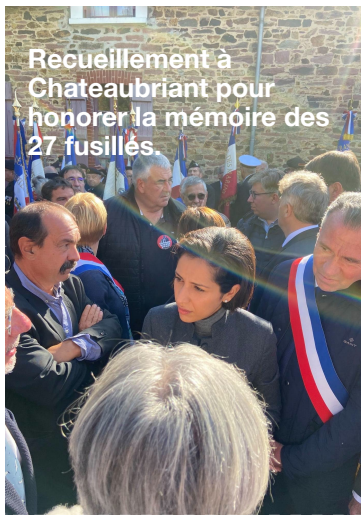
Recueillement à Chateaubriant pour honorer la mémoire des 27 fusillés.