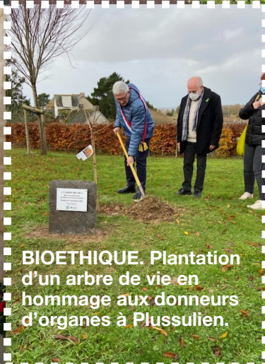
BIOETHIQUE. Plantation d'un arbre de vie en hommage aux donateurs d'organes à Plussulien.