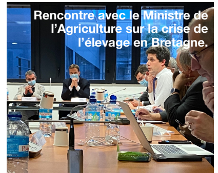
Rencontre avec le Ministre de l'Agriculture sur la crise de l'élevage en Bretagne.

Dans le prolongement de mes rencontres avec les éleveurs de Bretagne, rassemblés à l'initiative des organisations syndicales à la chambre d'agriculture, j'ai interpellé par écrit le Ministre de l'Agriculture sur l'urgence que revêt la juste prise en considération de leur situation spécifique. Diverses rencontres ministérielles avec Monsieur Denormandie et Monsieur Le Drian, m'ont donné l'occasion de solliciter l'engagement sans attendre de mesures gouvernementales de soutien aux trésoreries des exploitants.