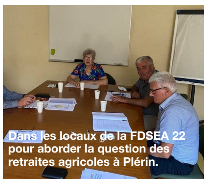
Dans les locaux de la FDSEA 22 pour aborder la question des retraites agricoles à Plérin.

Mais n'oublions que la revalorisation des retraites n'est pas sans poser la question du revenu des agriculteurs actuellement en activité. C'est à ce titre que j'ai proposé l' augmentation du paiement distributif de façon à permettre une répartition plus équitable des aides du 1er pilier de la PAC !