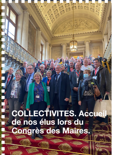
COLLECTIVITES. Accueil de nos élus lors du Congrès des Maires.