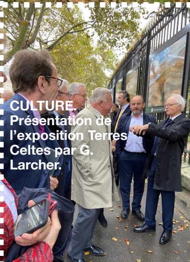
CULTURE. Présentation de l'exposition Terres Celtes par G. Larcher.