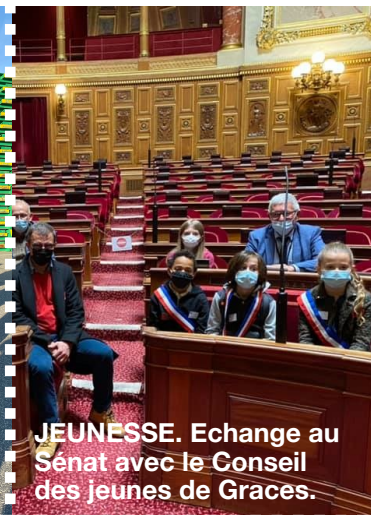
JEUNESSE. Echange au Sénat avec le Conseil des jeunes de Graces.