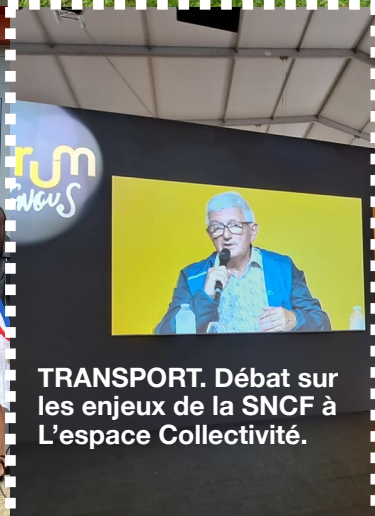
TRANSPORT. Débat sur les enjeux de la SNCF à L'espace Collectivité.