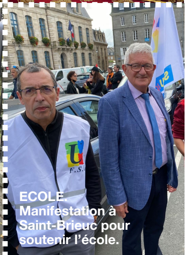
ECOLE. Manifestation à Saint-Brieuc pour soutenir l'école.