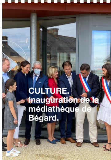
CULTURE. Inauguration de la médiathèque de Bégard.