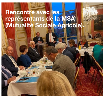
Rencontre avec les représentants de la MSA (Mutualité Sociale Agricole).